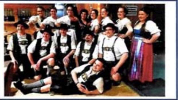
Trachtenverein Almrausch - Wasentegernbach