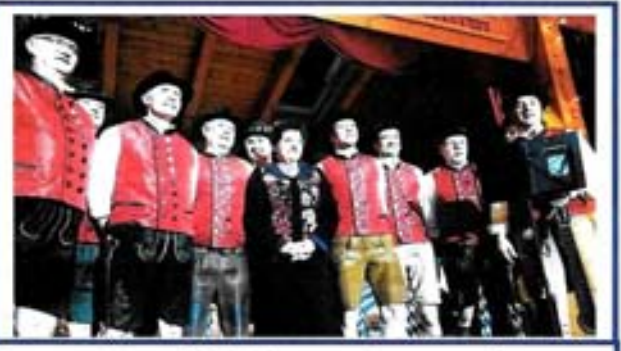
Das Holledauer Dutzend