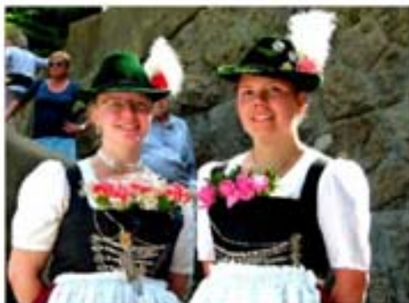
Zwoa fesche Madl'n vom Verein König Ludwig II. Starnberg