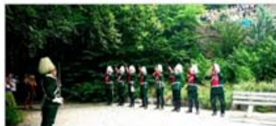
Ein Salut für den König