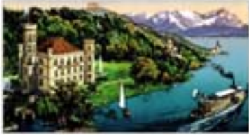
Schloss Berg am „Starnberger See“